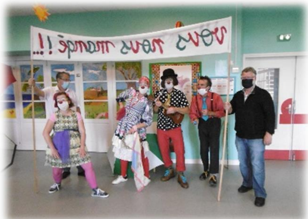
La venue des clowns après le confinement