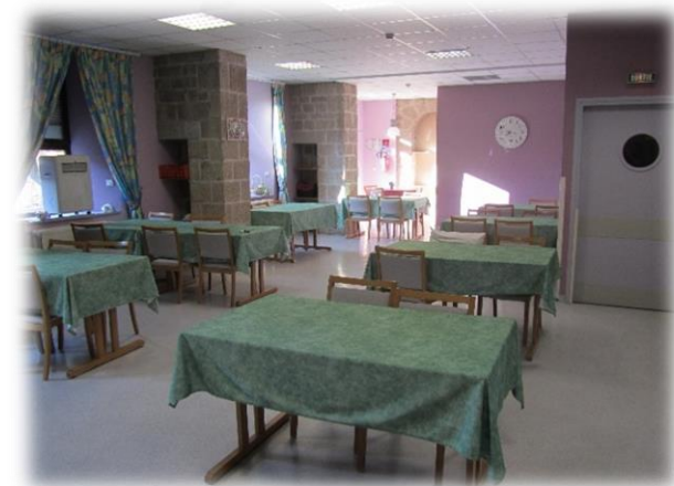
Salle à manger du RC.

Sur réservation (§ règlement de fonctionnement) et en fonction des places disponibles, les résidents peuvent recevoir des invités pour déjeuner. Le repas servi dans la salle à manger des familles peut être adapté sur