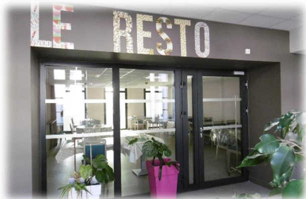
Salle à Manger du 1er étage

Le petit déjeuner est servi en chambre ou dans une des salles à manger des étages au choix des résidents.