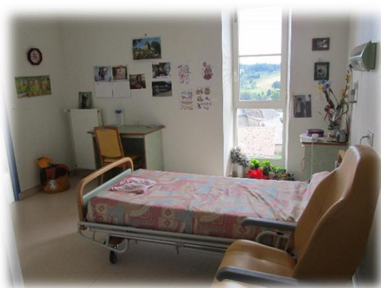
Possibilité de personnaliser

Elles sont équipées d'un système d'appel permettant de joindre rapidement le personnel à tout moment, d'une prise télévision et téléphonique. Elles peuvent être personnalisées par le résident, afin de retrouver autant que possible son « chez soi ».