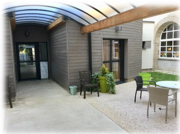
Entrée du PASA.

Animée par des professionnels spécifiquement formés, LE PASA fonctionne du lundi au vendredi de 9H30 à 16h30 et dispose de locaux dédiés situés dans la cour intérieure de l'établissement.