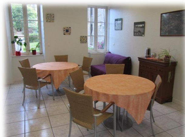
Espace repas pour les personnes extérieures.