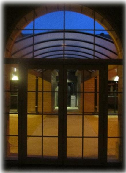
Vue sur l'entrée PASA, depuis le patio.

Dispositif créé par le PLAN ALZHEIMER 2008-2012, le PASA est un Pôle d'Activités et de Soins Adaptés destiné à offrir aux personnes résidant en EHPAD à titre permanent, et qui présentent des troubles du comportement liés à une maladie d'ALZHEIMER ou à une maladie apparentée, un accompagnement comparable à celui proposé en accueil de jour. Ce pôle a été mis en place en Mai 2013, construction des locaux en 2014, installation dans les locaux actuels en 2015 et labélisation par l'ARS en Janvier 2016.