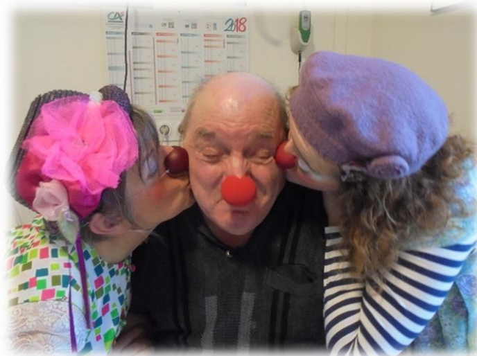
Les clowns avec nous, SINCE 2018